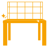
Plans de travail, tables