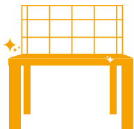
Plans de travail, tables